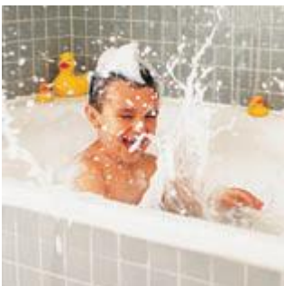
Baden en douches