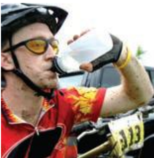
Her vulbare flessen